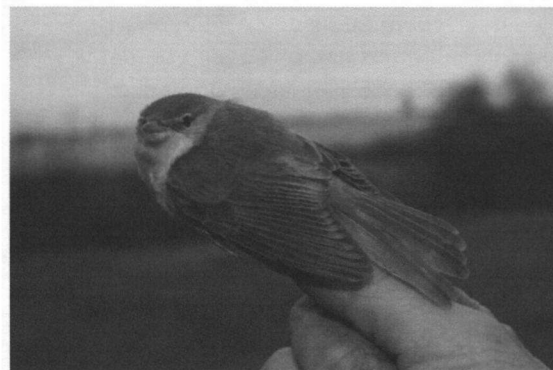
De nieuwjaarskarekiet van 1 januari 2012

Van alle jonge vogels overleeft slechts ongeveer een derde het eerste levensjaar. De lange reis en het verblijf in Afrika vergen hun tol en veel vogels komen om door uitputting onderweg, veroorzaakt door water en/of voedselgebrek. De kans voor oudere en dus meer ervaren vogels om de reis van Nederland naar Afrika en terug te overleven ligt op omstreeks 50% en is dus aanzienlijk groter dan die van de jonge vogels. De kleine karekiet die we op 2 augustus 2011 ving, was voor het eerst op Oud Naarden geringd op 16 augustus 2003, waarmee deze acht jaar oude vogel voor ons een record betekende. De oudst bekende vogels zijn voor zover bekend 12 jaar (Zweden) en 14 jaar (Groot - Brittannië) geworden. Dit kunnen we afleiden aan de hand van ringgegevens.