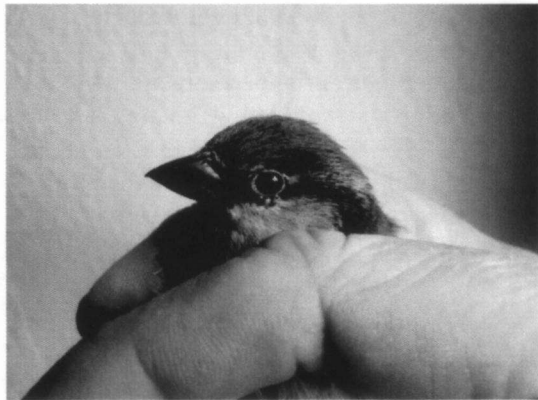
Huisemus man

Ik startte op 21 januari 2012 met mijn eerste vangsten in de achtertuin. De aantallen gevangen vogels hebben mijn stoutste verwachtingen verre overtroffen. Kon ik in deel 2 (Moolenbeek 2012b) melden dat ik ruim 200 vogels gevangen had en van een ring voorzien; nu ligt dit aantal bijna acht maal hoger. Wat is daar de oorzaak van?