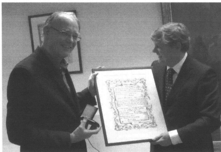
Uitreiken van penning en oorkonde

Ik word verlegen van de prijzen die ik kreeg. Ik ben erelid van de Vogelwerkgroep, in 1992 kreeg ik de Gouden Lepelaar van Vogelbescherming Nederland en ik heb voor mijn ijsvogelproject in 2006 de allereerste Paul Fentener van Vlissingen / AD Natuurprijs gewonnen. En héél kort geleden kreeg ik de Emil Ludenpenning die wordt uitgegeven door de Stad en Lande Stichting, Stichting Tussen Vecht en Eem, Vereniging Vrienden van het Gooi en Stichting Gooisch Natuurreservaat. De penning is in 1983 ingesteld en ik was de achttiende persoon die 'm kreeg. Dus ja, ik krijg wel erkenning. Iedereen vindt het leuk om een schouderklopje te krijgen en daar hoor ik ook bij. Zonder dat doe ik het ook hoor. Ik doe het vooral omdat ik het vreselijk interessant, leuk en nuttig vind, maar met een prijs en nu weer deze penning gaan er wel deuren voor je open, en daar profiteer ik dan weer van.