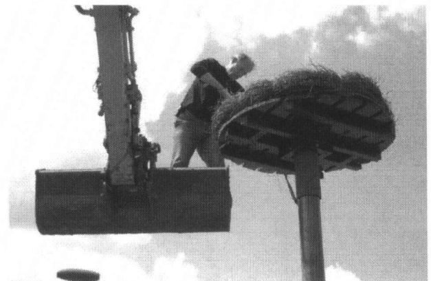
Plaatsen van een ooievaarspaal en - nest

Die stichting werd na een fusie Landschap Noord-Holland. Het is een grote organisatie en ik heb er vijftientig jaar gewerkt, vooral in het Gooi en de Vechtstreek. Al snel specialiseerde ik mij in het verbeteren van het leefgebied van diersoorten, zodat ze zich beter kunnen voortplanten en zich handhaven. Ik hou ervan om een ecologische infrastructuur op te bouwen voor diersoorten. Ik heb mijn projecten altijd allemaal zelf bedacht, subsidies geregeld, uitgevoerd en de monitoring georganiseerd. In al die jaren is er nog nooit een leidinggevende geweest die tegen mij zei: je moet dat project gaan doen. Ik deed soms wel bijna 40 projecten per jaar. Van klein tot groot. Het samen met anderen, vooral ook vrijwilligers, was daarbij een belangrijk nevendoel.