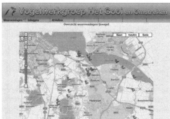
Waarnemingen van ijsvogels in 2013

Op de website van de Vogelwerkgroep hebben we sinds 2008 de mogelijkheid om ijsvogelwaarnemingen te melden.