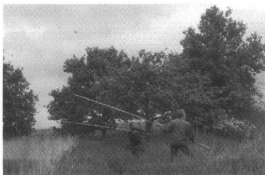
Harry de Rooij en Rob Moolenbeek op gierzwaluwenjacht

Ook op de laatste zondag van mei kwam de temperatuur nauwelijks boven de 10 °C en er stond een harde wind. Verre van ideaal vangweer dus. Door de dreigende buien en de harde wind vlogen de zwaluwen erg laag en dat gold ook voor de gierzwaluwen. Dit bood een gelegenheid om de netten als slagnet te gebruiken en de gierzwaluwen uit de lucht te halen, zoals bijgaande foto laat zien.