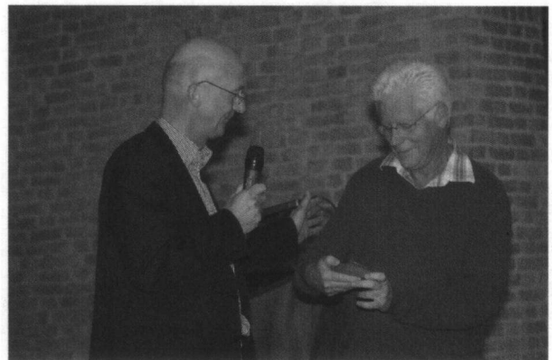
De voorzitter van de VWG overhandigt Rien de Zilveren Korhaan

De Fotowerkgroep toonde op panelen langs de zijkant van de kerk een selectie van haar foto's. Echt kwalitatieve hoogstandjes, waar iedereen met bewondering naar keek.