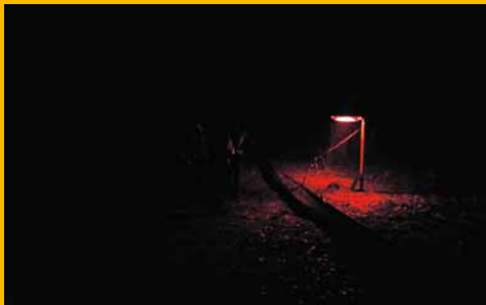
In het niet verlichte vak en het rood verlichte vak werden de meeste padden aangetroffen in de vangemmers.

verlichting kan de trek hinderen. De drang om naar het water te gaan is heel sterk en het zal de padden dan ook zeker niet stoppen. Het is misschien zelfs mogelijk om padden een beetje te sturen met licht. Als het druk is op de weg de witte verlichting aan om ze af te remmen, en als het rustig is op de weg de verlichting uit zodat ze veiliger kunnen oversteken. Als een paddentunnel wordt aangelegd kan dat beter niet te dicht bij een lantaarnpaal met wit, blauw of groen licht gebeuren maar juist op een donker stuk of bij rood licht. Uiteraard komen op plekken