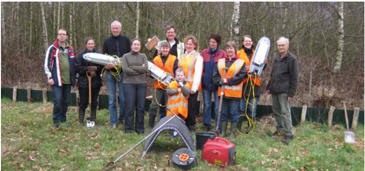
Vrijwilligers Paddenwerkgroep Amerongen met materialen lichtonderzoek.

verlichting een effect heeft op in het wild levende dieren kan iedereen zelf zien aan de insecten die op lampen afkomen. Maar toch is er pas heel recent meer onderzoek gedaan aan het effect van kunstlicht op wilde planten en dieren. In Nederland is dat onder andere door het project Licht op Natuur (Spoelstra et al. , 2015) van de Wageningen Universiteit, NIOO en VOFF (zie www.lichtopnatuur.org ). Amfibieën zijn nachtdieren en jagen grotendeels op zicht en mogelijk dus gevoelig voor kunstlicht. We weten dat padden (Baker, 1990) en kamsalamanders (Creemers, 1992) zich in de zomer bij lantaarnpalen verzamelen, waarschijnlijk om daar insecten te eten die op het licht zijn afgekomen. Maar ook de padden die naar het water migreren in het vroege voorjaar komen steeds vaker verlichting tegen bij de wegen die ze oversteken. Wat heeft dit voor gevolgen? Blijven deze dieren dan ook onder de lamp op de weg zitten met grote risico's op aanrijdingen? Nu hebben padden in het vroege voorjaar heel andere dingen aan hun hoofd dan eten, mogelijk gedragen ze zich in het voorjaar anders dan in de zomer.