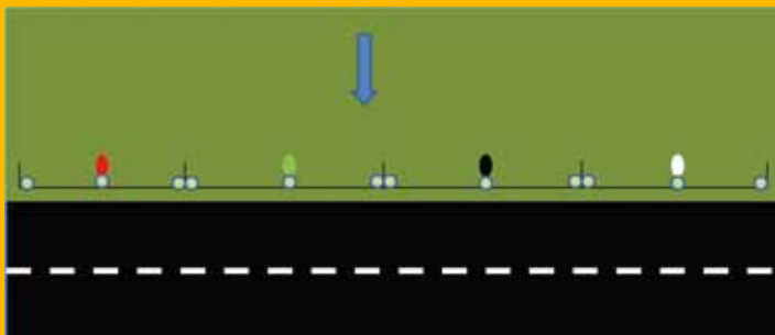
Figuur 1. De opstelling met schermen (zwarte lijn) die de padden tegen houden en in de emmers (witte stippen) dirigeren. Daarbij zijn drie vakken verlicht met rood, groen of wit licht (gekleurde stippen) en 1 vak donker (zwarte stip). De blauwe pijl geeft de voorjaarstrekrichting aan.