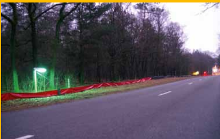
Lichtopstelling langs traject Kootwijk.