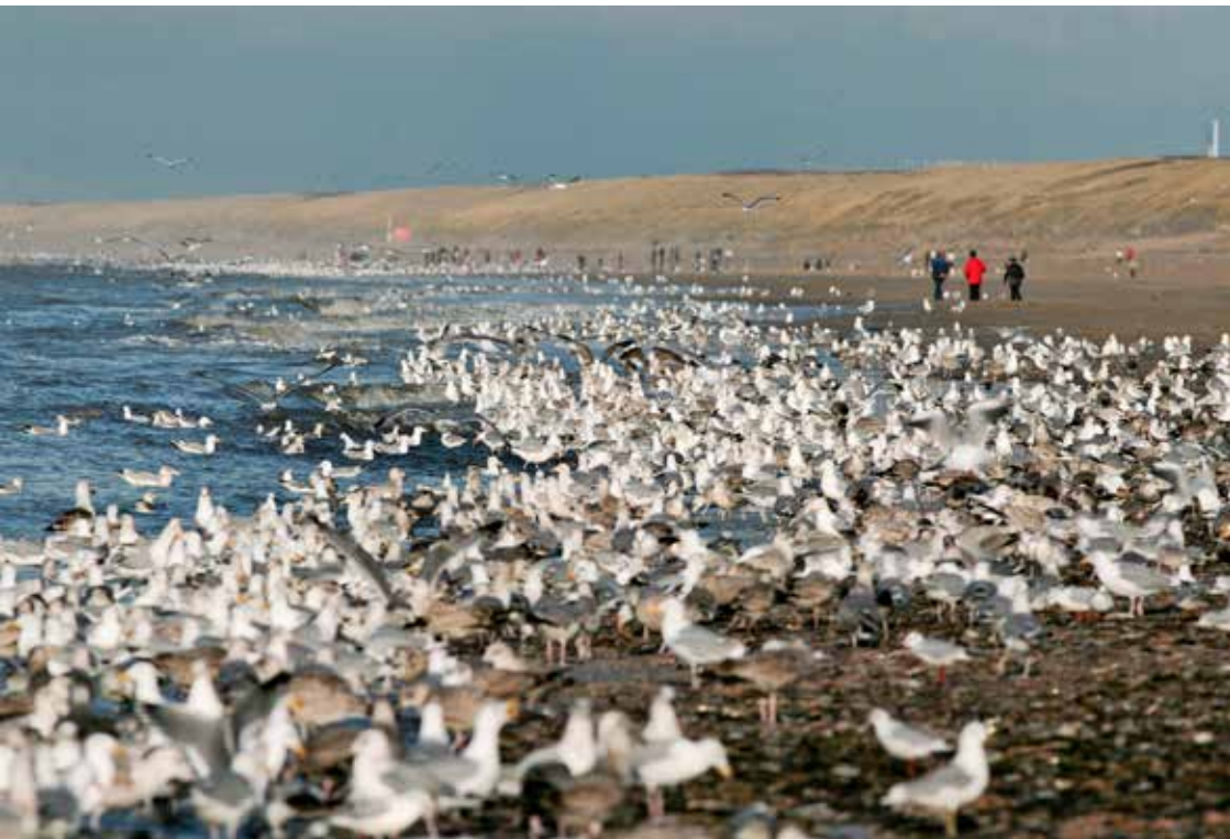
Strand als recreatiegebied: frequente verstoringen maken tellen lastig.

strand van belang. Tijdens een nachtelijke wandeling op 27 december 2012 rustten er minimaal 3 zeehonden op het strand bij de provinciegrens.