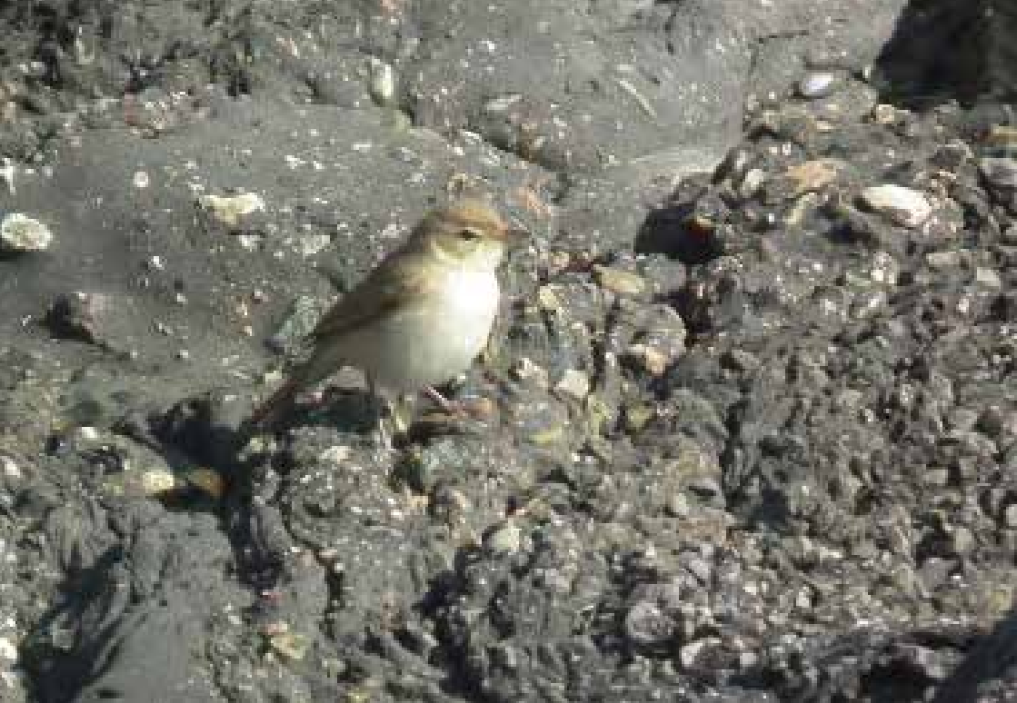
KLEINE SPOTVOGEL

Afgelopen jaar beleefde Nederland een influx van Zwarte Ibissen. Overal doken groepjes op en ook in Zuid-Kennemerland werden er meerdere gezien. Zelf was ik verder erg blij met twee persoonlijke nieuwe regio-soorten. Begin oktober ontdekte onze ganzenman Fred Cottaar een fraaie adulte Dwerggans tussen de Grauwe en Kolganzen die heen en weer pendelden tussen de slaappleats Houtrakkerbeemden en foerageergebied Inlaagpolder. De vogel bleek geringd met een aluminium ring, maar volgens Fred worden wilde vogels in Scandinavië op die manier wel gemarkeerd. Daarna dook er gelukkig weer snel een Zwarte Zeekoet op. In 2011 was er al een vogel bij de Zuidpier die ik jammerlijk miste omdat de auto bij de garage was.... Maar half oktober 2013 ontdekte Wim van der Schot (niet voor het eerst dat hij een goede soort vindt) een fraaie onvolwassen Zwarte Zeekoet bij de Zuidpier. Deze bleef een hele tijd zitten en liet zich vaak prachtig bekijken, wanneer hij de ene na de andere opgedoken prooi verorberde.