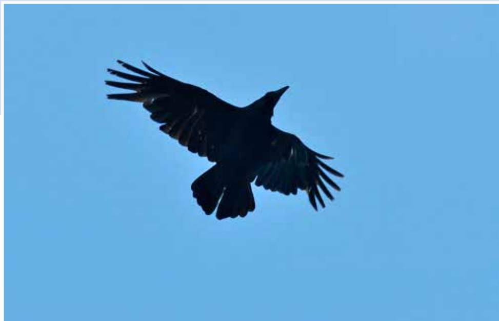
Een RAAF in Wassenaar.

Afgelopen winter werden in en rondom de AWD regelmatig Raven waargenomen. Is de soort terug van weggeweest?