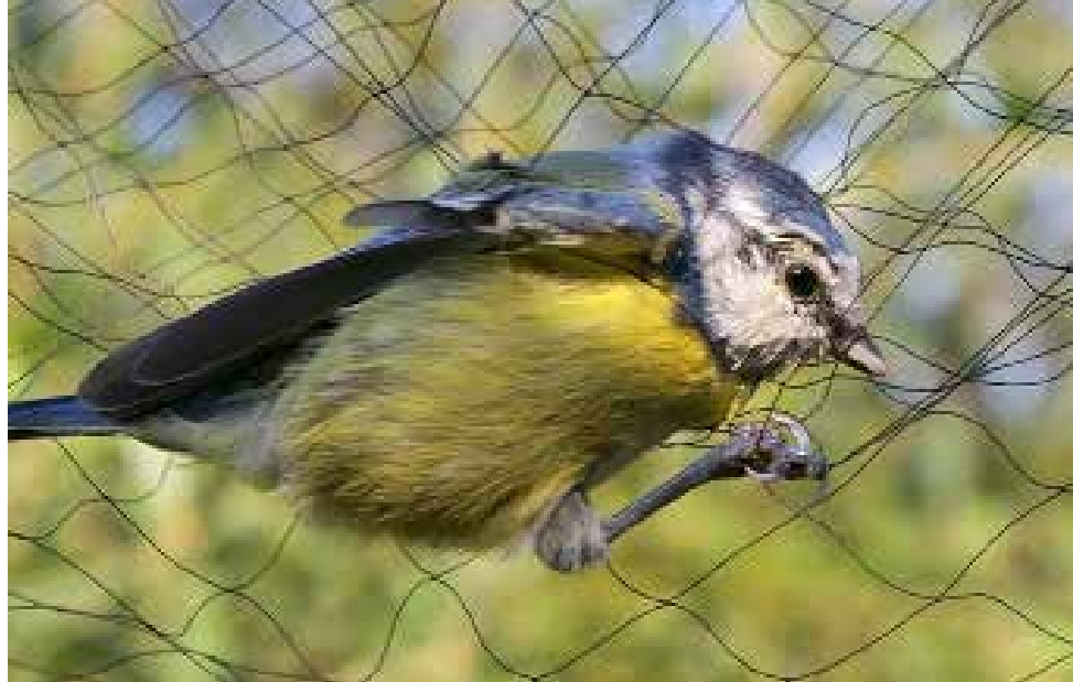
Gevangen PIMPELMEES . Foto's en illustratie uit Jaarverslag.

De slagnetten hebben hun dienst, ook in 2013, weer goed bewezen. Een behoorlijk aantal steltlopers, Graspieters , Kramsvogels en Veldleeuweriken waren te traag om aan de netten te kunnen ontsnappen.