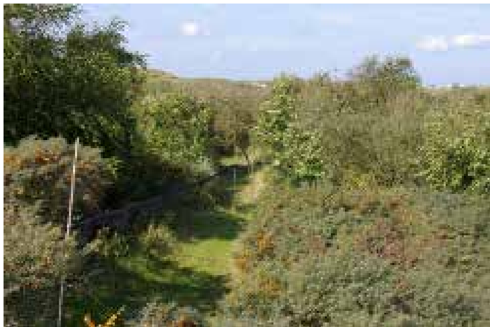
Opstelling van mistnet rond het vogelringstation in de AWD.

Het Eendeneiland is overgeleverd aan de elementen van de natuur en moet nog ontmanteld worden.