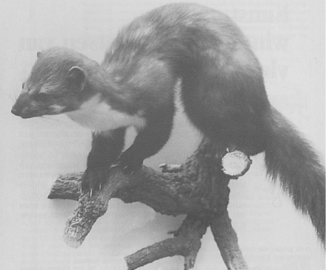
De steenmarter die op 5 januari 1990 langs de weg Oostburg-Sluis werd gevonden, opgezet door G. Prang.

● We proberen de uitbreiding van het areaal van de steenmarter in Nederland zo goed mogelijk te volgen. Informatie over het voorkomen van steenmarters is daarom steeds erg welkom.