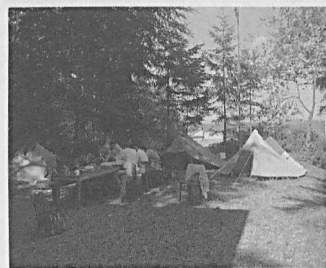
De kampdeelnemers in Wilz, Luxemburg.

aandacht. Een Duitse dassenonderzoeker vertelde over zijn werk. Daarna zijn enkele km 2 afgezocht op dassenburchten. De meeste hollen bleken vossenholten te zijn. Toch vond men ook een grote dassenburcht en enkele versgegraven pijpen met dassenharen. Daar werd gepost, maar al wat zich liet zien was een vos.