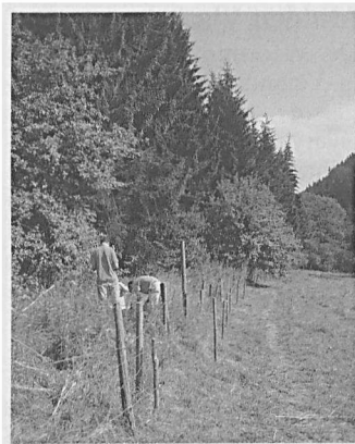
Het controleren van de vallen in Luxemburg.

op een beperkt aantal vangplaatsen op te stellen. Dit beperkte ook de tijd die nodig is voor de controles, zodat de deelnemers zich met veel andere aspecten van zoogdierwerk konden bezig houden.