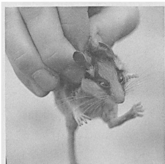
De eikelmuis was geen zeldzaamheid op het VZZ-kamp.

Het zomerkamp van de Veldwerkgroep van de VZZ vond plaats in Wilz (Luxemburg). Het belangrijkste en meest intensieve onderzoek was de muizeninventarisatie met behulp van inloopvallen. Tijdens het kamp in de Haute-Savoie in 1989 bleek het vangstpercentage laag. Daarom was besloten dit jaar een groot aantal vallen