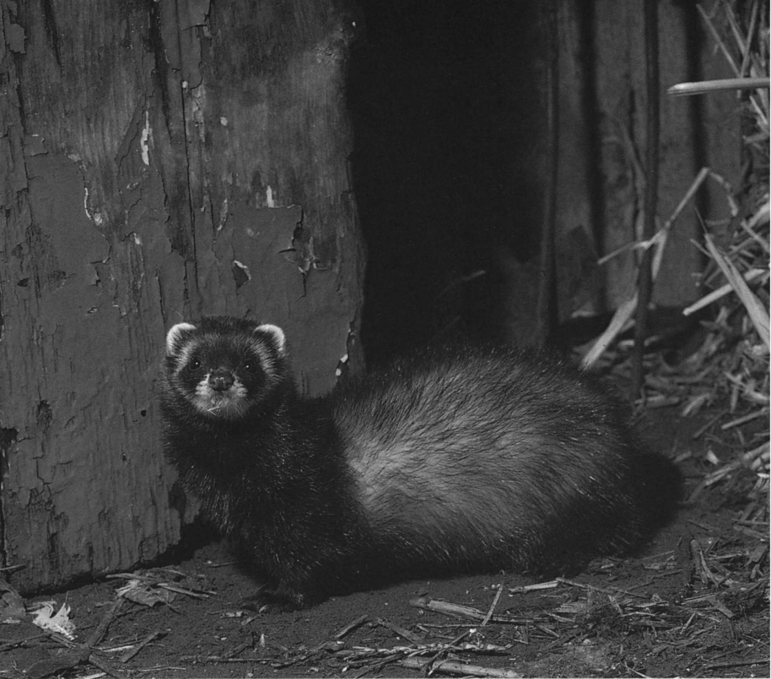
Bunzingen komen nog al eens voor in de omgeving van de mens

nog vele minuten vanuit een opening tussen de dakpannen naar buiten kijken.