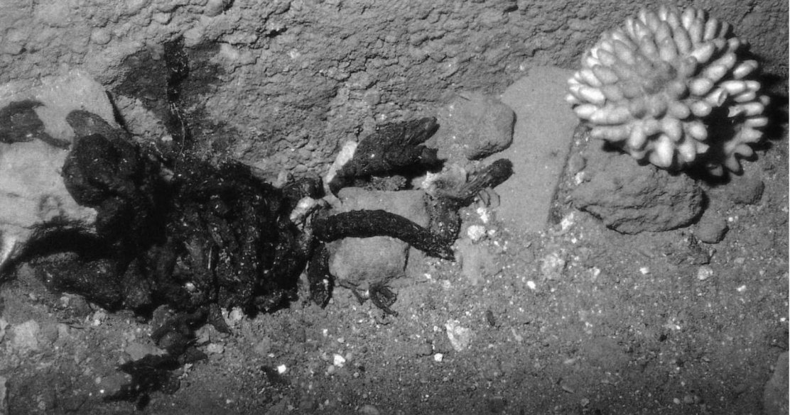
Steenmarterkeutels en een aangeknaagd speelgoed-egeltje. Het 's nachts op zolder spelen met allerlei voorwerpen kan heel wat kabaal met zich meebrengen.

ters kunnen nog niet echt goed klimmen, zodat de moeder ze naar een plaats brengt die gemakkelijker toegankelijk voor ze is, zodra de jongen haar goed kunnen volgen. Dan is het probleem vanzelf voorbij. Om herhaling te voorkomen is het dan wel belangrijk om de toegang tot de nestplaats af te sluiten.