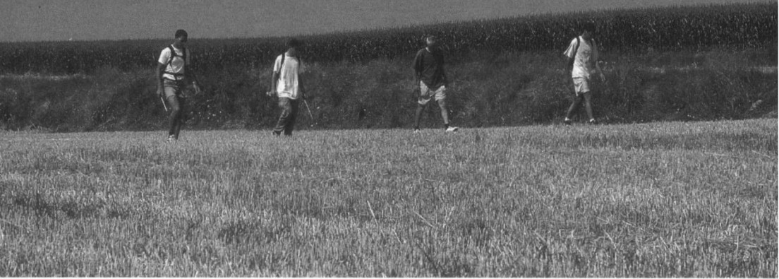
Het inventariseren van hamsters in graanvelden kan eigenlijk alleen in de korte tijd tussen oogst en omploegen.

richtlijnen verplicht de overheden 'de vinger aan de pols' te houden en bij achteruitgang in te grijpen. Dit wordt echter voor de hamster niet gedaan.