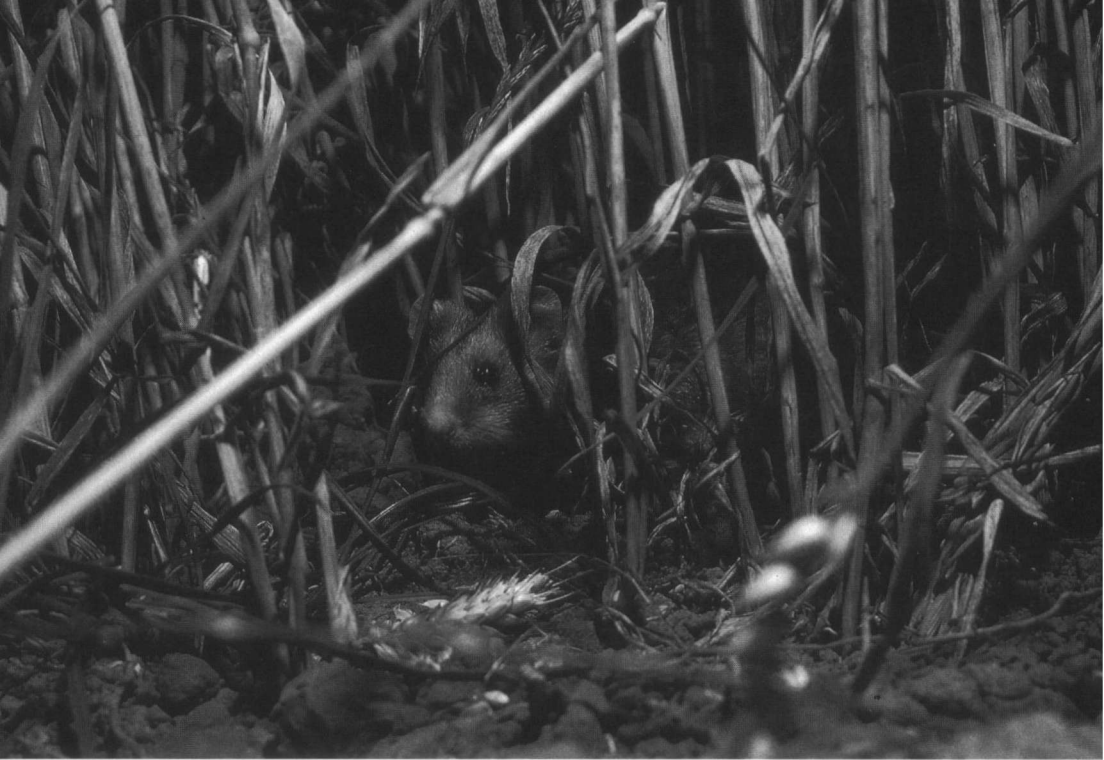
Wat de vooruitzichten voor de Nederlandse hamster zijn hangt erg af van wat er dit jaar, 2000, gebeurt.

december wordt Nederland door de Raad berispt wegens het schenden van de conventie. Er moet nu elk jaar aan de lidstaten gerapporteerd worden wat er door Nederland wordt ondernomen om de hamster te redden.