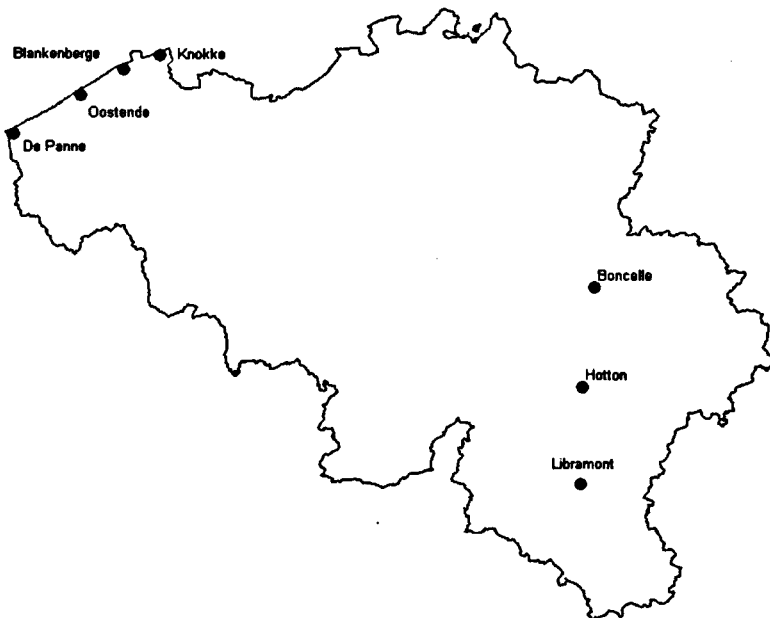
Verspreiding van de tweekleurige vleermuis in België.

Het tot nu toe laatste gedocumenteerde geval van een tweekleurige vleermuis in België dateert van 10 september 2002. Een Vlaming vond in het Waalse dorpje Hotton, midden in de Ardennen, een vleermuis in een kippenhok! Het verzwakte diertje werd onophoudelijk door de kippen belaagd, maar door zijn reddende menselijke engel werd het kort nadien in een doosje meegevoerd naar Antwerpen, waar het door de vleermuiszenwerkgroep werd gefotografeerd en op naam gebracht. Dit was de zevende vindplaats van een tweekleurige vleermuis in België. Het diertje werd verzorgd en kort nadien nabij de vindplaats weer vrijgelaten.