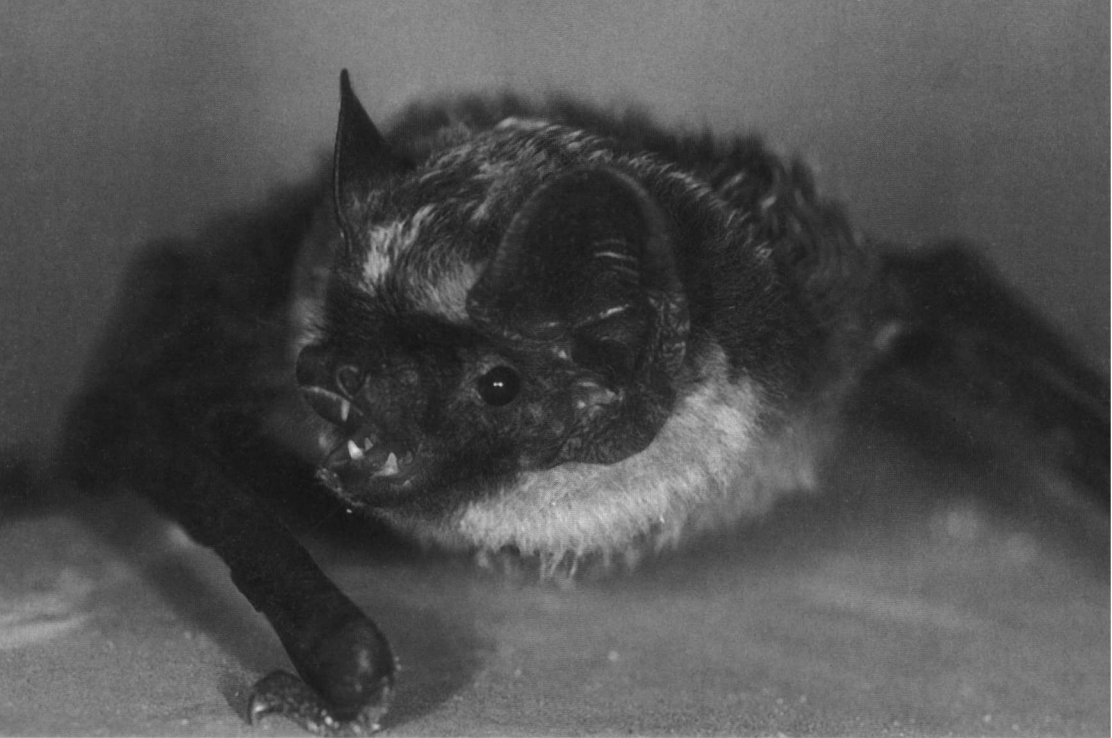
Vrouwtje van de tweekleurige vleermuis op de vijfde vindplaats voor België.

leken in heterodyne vrij sterk op die van laatvlieger, maar door het loskomen van een kabeltje werden de geluiden in time-expansion niet opgenomen.