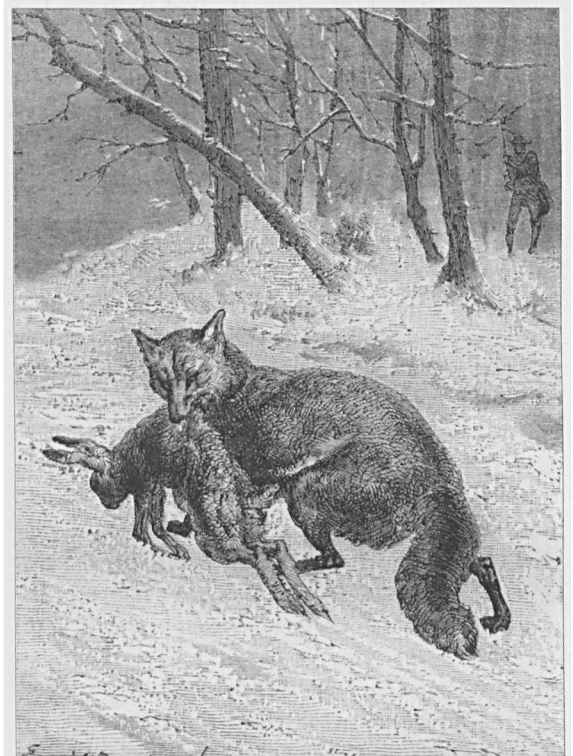
"Zoveel onbeschaamdheid verdient kastijding."

Anekdotische informatie van zeldzaam en moeilijk waar te nemen gedrag bij zeldzame dieren kan van grote waarde zijn. Door het toevalskarakter ervan gebeuren zo'n waarnemingen meestal door 'gewone mensen'. Die mensen vinden, hen kritisch interviewen en hun waarnemingen nauwkeurig noteren, is een kunst op zich. Helaas ligt de frequentie waarmee dergelijke fenomenen worden waargenomen dikwijls teleurstellend laag. Hoeveel mensen zouden ooit in de vrije natuur van nabij een mopsvleermuis een nachtvlinder hebben zien verschalken? Een klein clubje volhouders wellicht. Soms is het rechtstreeks en in de vrije natuur waarnemen de enige manier om iets over dierlijk gedrag te weten te komen. Een lage waarnemingsfrequentie heeft ook als gevolg dat je voor een compleet overzicht van