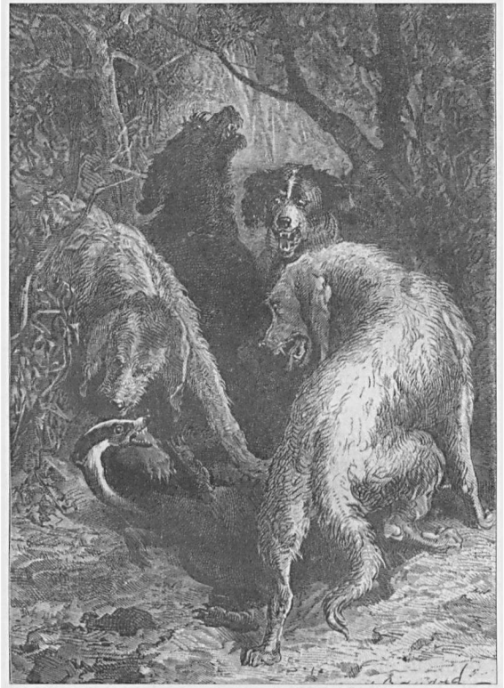
"Zo slecht het beest kon lopen, zo goed kon het bijten."

een markt, maar het best ga je zoeken in de archieven of bibliotheken van abdijen, kastelen of universiteiten. Om u te laten meegenieten van de uitzonderlijke verhalen die deze boeken dikwijls herbergen, start in dit nummer van Zoogdier de reeks: Uit de oude doos. Over zoogdieren uit vergeten boeken.