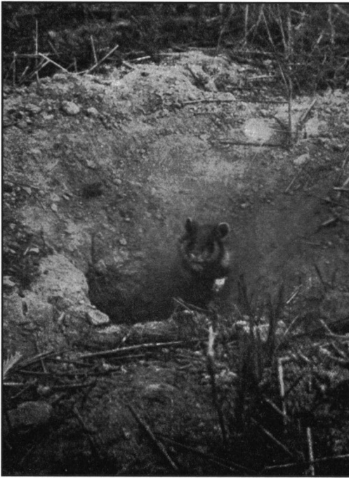
De hamster: "Een lastige Limburger"

.Kerst Zwart besluit zijn boek met "De Tien Geboden van den Wandelaar:" Gebod I en 10 wil