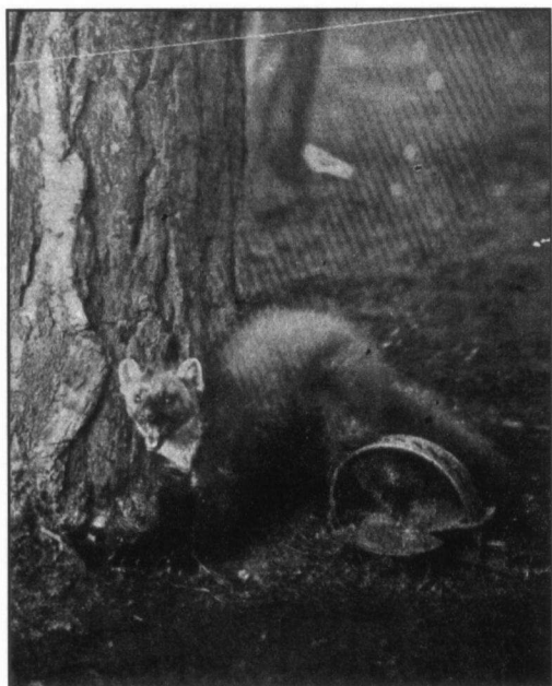
"Marter in de klem"