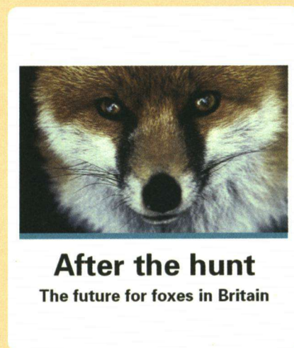
After the hunt The future for foxes in Britain

Na de jacht Deze publicatie stelt de retorische vraag of er nog een toekomst is voor de vos in Groot-Brittannië 13 . Het beestje is er immers allerminst geliefd bij jagers en onderwerp van verhitte discussies.