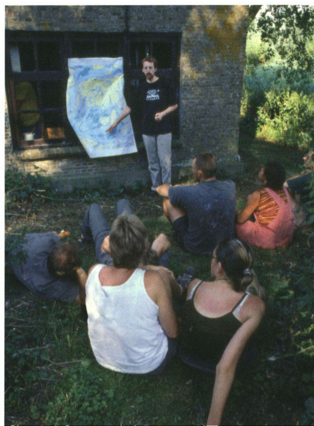
Links: Veldwerk kan heel ontspannend zijn, zoals wachten op uitvliegende vleermuizen met een bakje koffie. Rechts: Voorafgaand aan het tellen van bevers in de Biesbosch wordt uitleg gegeven over de vaarroutes en het onderscheid met muskus- en beverratten.