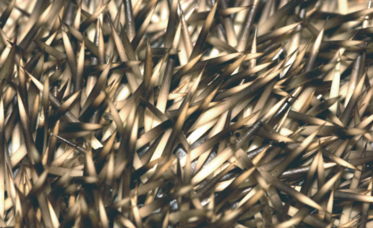
Stekels van een egel.