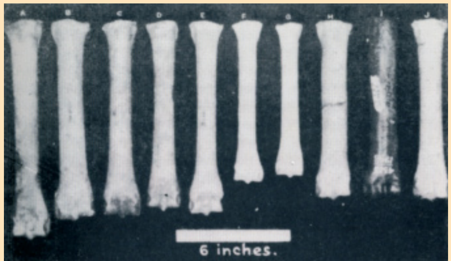
Figuur 1 Metatarsalen (botten uit onderbeenen, red.) van (links naar rechts): moderne Arabier (a), Romeinse paarden (b, c, d en e), hedendaagse Shetlandpony (f), Keltische pony uit de ijzertijd (g), Pleistocene pony uit Sussex (h), Pleistocene pony uit Alaska (i), jonge Exmoormerrie (j). Bron: Speed & Speed, 1977.

De kiezen van Exmoorpony's, Przewalskipaarden en Pleistocene paardenfossielen bleken diepgeworteld en recht in een diepe onderkaak te staan. De Speeds vonden de beenderen van Exmoorpony's meer lijken op die van Pleistocene paarden dan op die van hedendaagse gedomesticeerde paarden. Zij leidden hieruit af dat de Exmoorpony raszuiver is gebleven en, samen met andere wilde paardentypen, de basis zou hebben gevormd voor een aantal Noordwest-Europese gedomesticeerde paardenrassen (Speed & Speed, 1977). Ook Ebhardt (1962) kwam op grond van soortgelijk onderzoek aan beenderen tot deze conclusie.