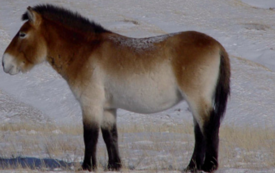
Przewalskipaard in wintervacht.

Halverwege de vorige eeuw bestudeerde het Engelse echtpaar Speed de beenderen