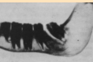
Figuur 4 Shetlandpony (twee grote en enkele kleine kiezen in een smalle kaak).