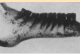
Figuur 2 Röntgenfoto onderkaak arabisch paard van 2250 jaar oud (kleine kiezen in een smalle kaak).