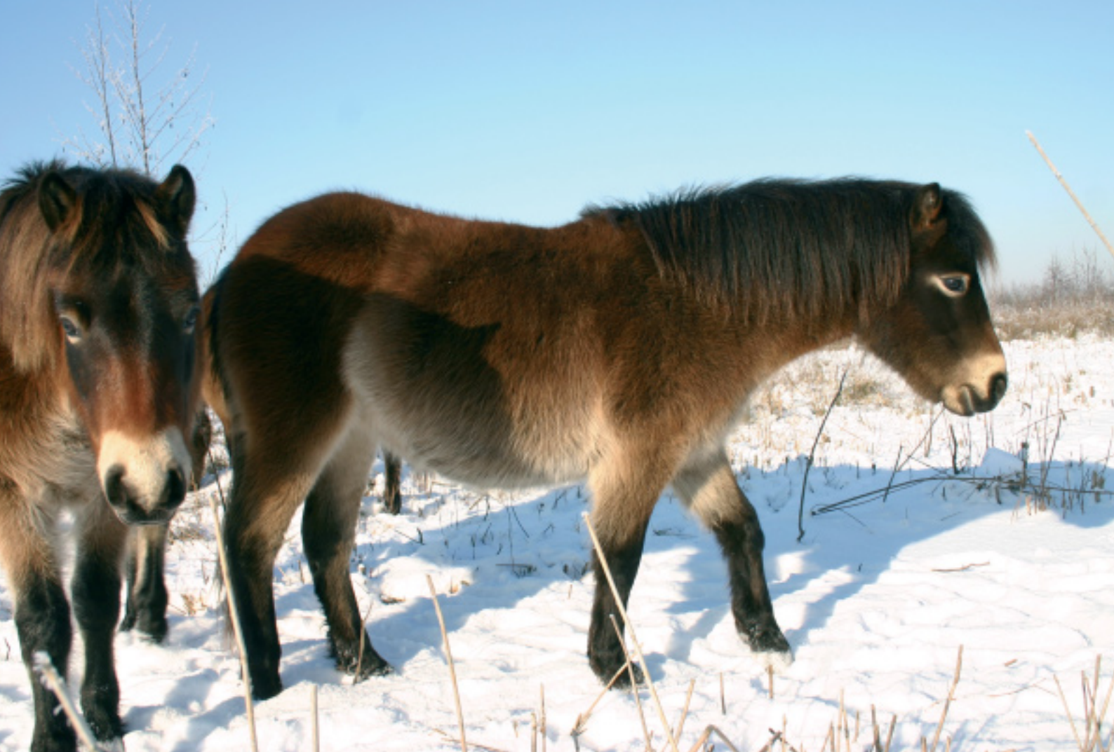
Twee jaar oude exmoorpony's in wintervacht.