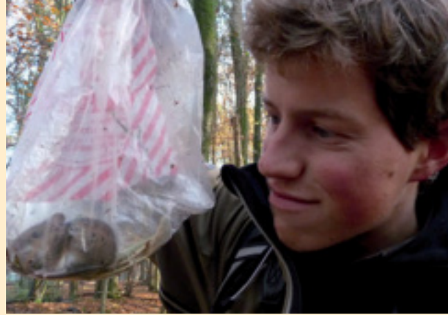
Grote bosmuis gevangen bij Winterswijk.

Meer info op: http://www.natuur-forum.be:80/phpBB3/viewtopic.php?f=2&t=6533