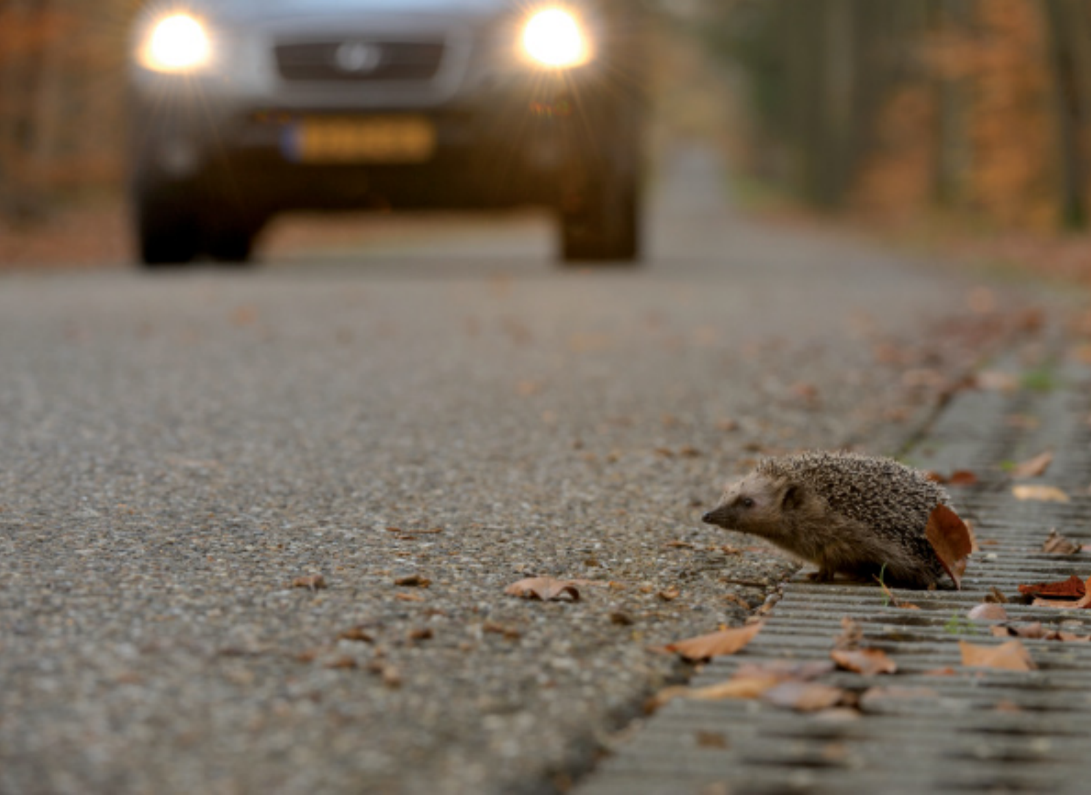
Verkeer is een vaak voorkomende doodsoorzaak van egels.

nieuws. Egels blijken dus nog steeds prima in staat dicht bij mensen te leven. In de gegevens valt op dat er in bepaalde delen van Nederland, zoals op de Veluwe en in grote delen van Flevoland, nauwelijks egels zijn gemeld. Dat zou kunnen liggen aan minder mensen en dus minder waarnemers, maar in andere dunbevolkte gebieden blijken wel aardig wat egels gemeld te zijn. Zo zagen in Drenthe inwoners en vakantiegangers wel veel egels. De grootschaligheid van het landschap in zowel Flevoland als op de Veluwe zou wel eens de oorzaak voor een kleinere egeldichtheid kunnen zijn. Kenmerkend voor de Veluwe zijn ook de op zandgronden gelegen uitgestrekte bosgebieden. Uit het Europese verspreidingsbeeld is bekend dat de egel vooral grote (naald)bossen op zandgronden mijdt, vermoedelijk omdat de egel daar minder voedsel en moeilijker geschikte slaap – en overwinteringsplekken, zoals dichte struiken met een dik bladerdek, kan vinden. Het waarnemingspatroon op de Veluwe heeft dus een ecologische achtergrond, die door de literatuur wordt onderschreven.