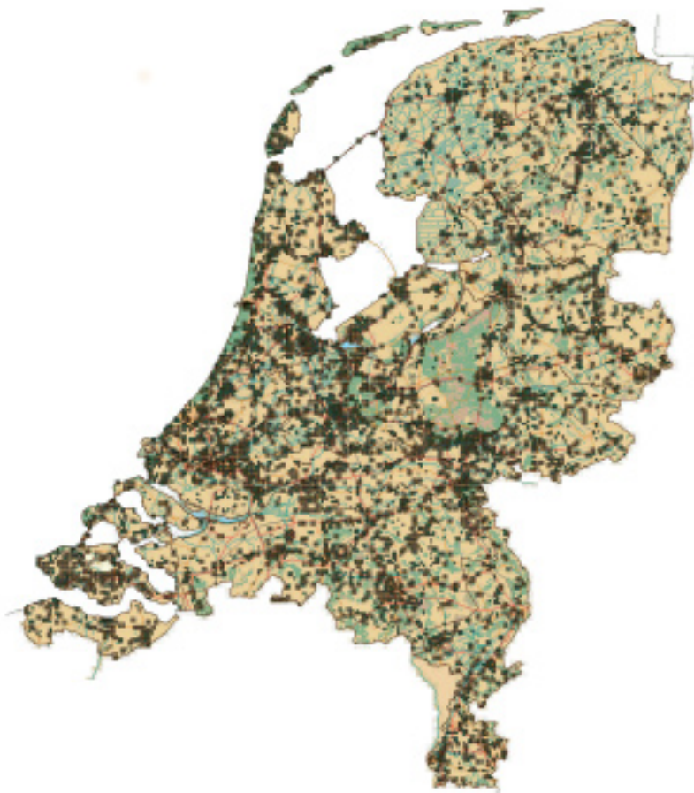
Figuur 1 Verspreiding van de egel in 2009 gebaseerd op meldingen in heel 2009