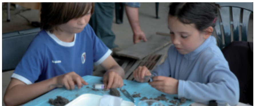
Braakballen pluizen.

Eind september 2009 ging de Zoogdierenwerkgroep tijdens het Ardennenweekend op zoek naar heel wat spectaculairs, gaande van (sporen van) bevers over burlende herten tot de zeldzame Millers waterspitsmuis. Deze laatste hebben we jammer genoeg niet kunnen waarnemen, maar we deden heel wat andere spectaculaire waarnemingen.