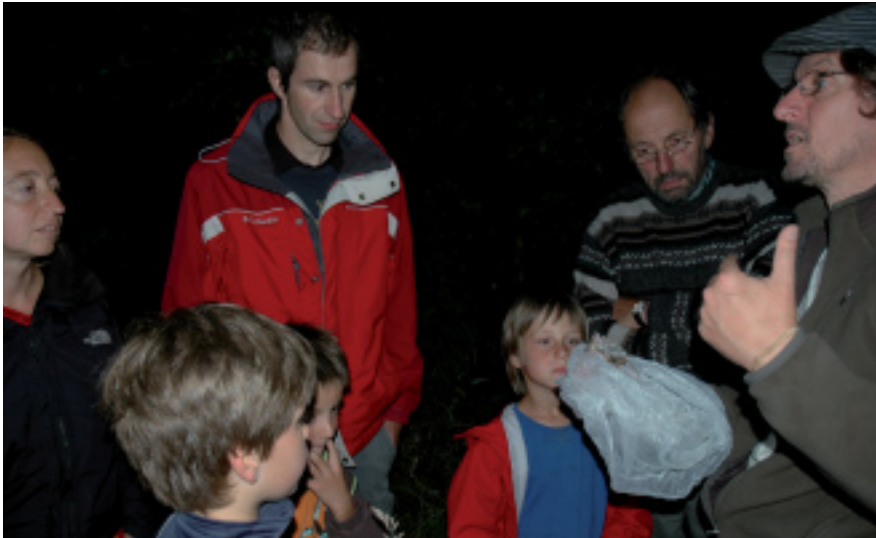
Nachtelijke excursie tijdens de 'kortste nacht' 2009.

Derde editie 'Kortste Nacht van het Zoogdier' duikt het water in