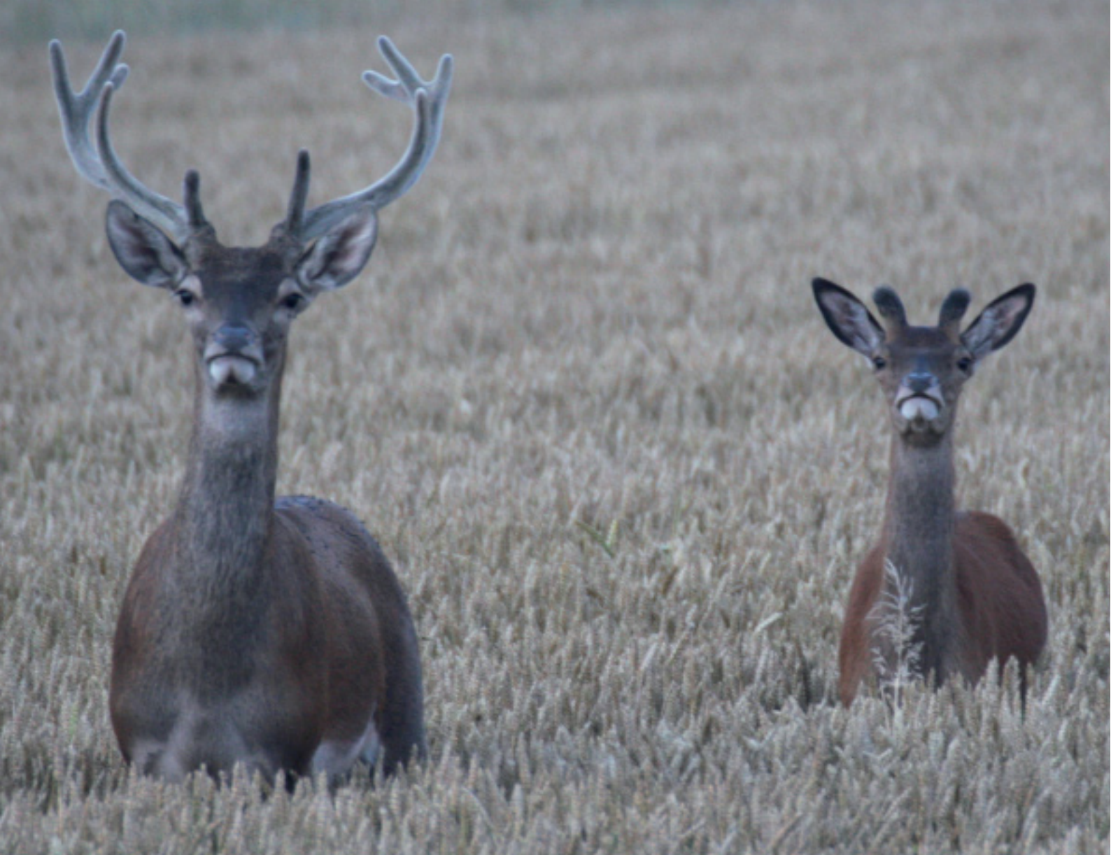
Het zijn vooral jonge mannelijke edelherten die allereerst op zoek gaan naar nieuwe leefgebieden.

rond 1850, is het edelhert ook verdwenen uit oostelijk, zuidelijk en centraal Nederland. Vanaf die tijd is de Veluwe het enige leefgebied. Sinds die tijd heeft de Veluwe als refugium gefungeerd voor ons grootste in het wild levende landzoogdier.