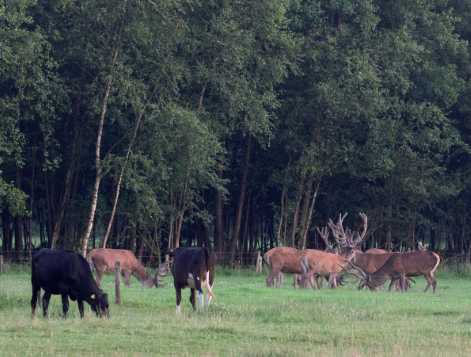
Edelherten vormen, in tegenstelling tot wat vaak gedacht of aangenomen wordt, geen extra veterinaire risico's ten opzichte van gebieden waar reeën voorkomen (vrijwel heel Nederland dus).

men samen één groter leefgebied. Tussen deze twee leefgebieden vindt namelijk vrijwel dagelijks uitwisseling van edelherten plaats. Een derde leefgebied, in figuur 3 aangeduid als 'Graf Merfeld', is geïsoleerd van de andere twee leefgebieden door de barrière die de snelweg E31 Bottrop-Emden vormt. Binnen afzienbare termijn zal door de bouw van een ecoduct over de E31 in de Üfter Mark de uitwisseling van edelherten tussen de drie leefgebieden weer kunnen plaatsvinden.