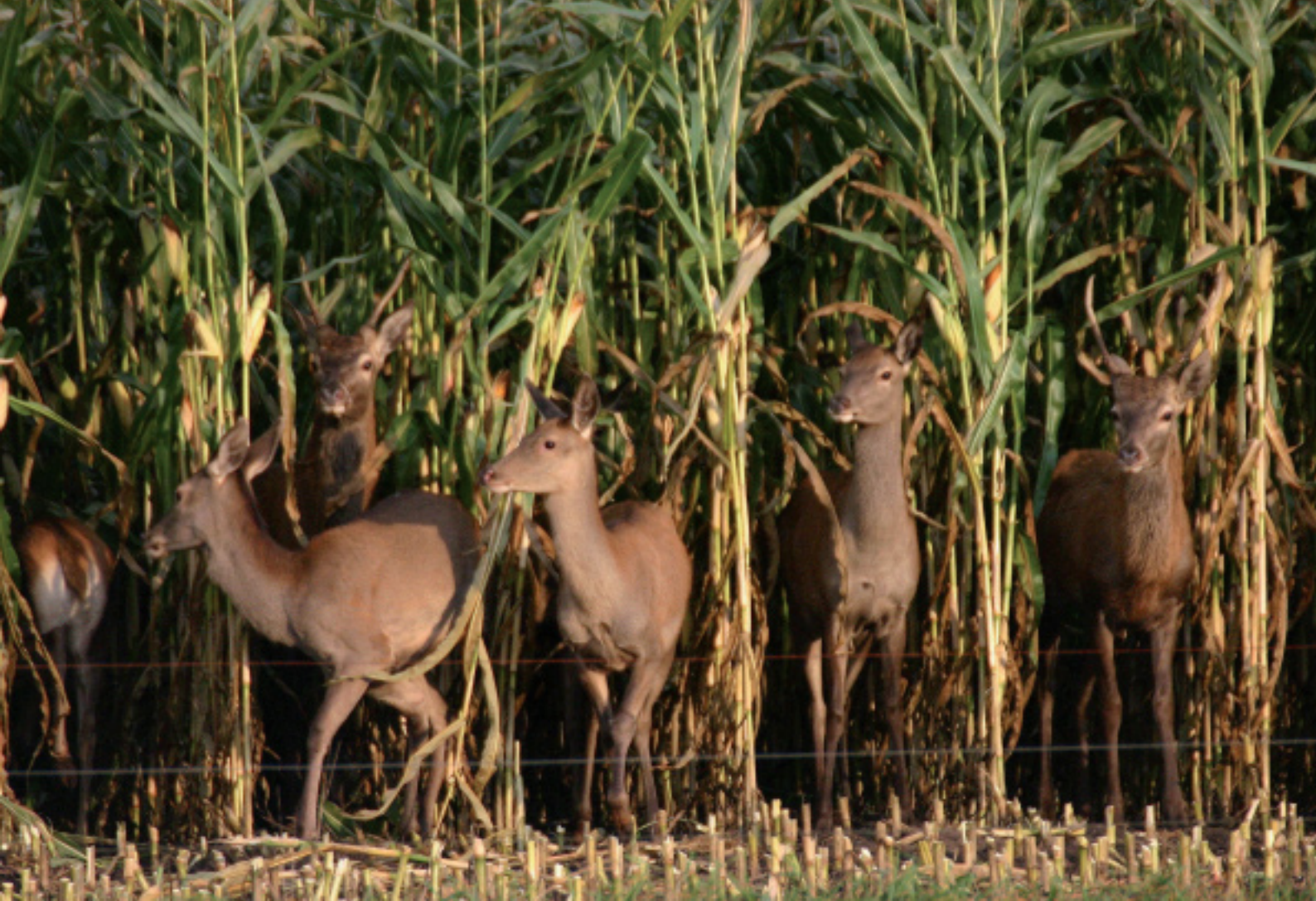
Maïs biedt edelherten in de zomermaanden zowel voedsel als dekking.