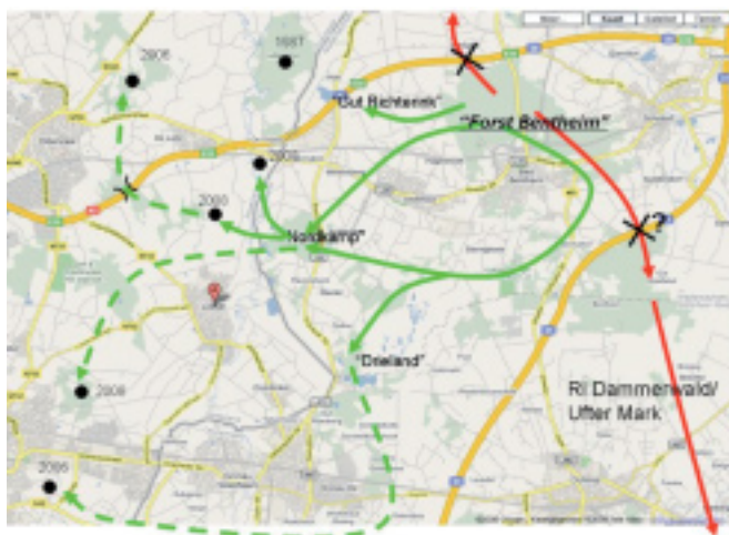
Figuur 2 Trekroutes vanuit Forst Bentheim naar Nederland inclusief waarnemingen edelherten t/m 2008. De rode pijlen geven de door de ontwikkeling van de snelwegen verloren gegane historische trekroutes. De groene pijlen geven de trekroutes zoals die nog gebruikt worden (bron: mededelingen Detlev Heyden, Forst Bentheim).

Als standwild is het edelhert sinds het midden van de achttiende eeuw uit Twente verdwenen. Hoekstra vermeldt evenwel al in de KNNV-uitgave 'De zoogdieren van Twente' (1967) dat het nadien af en toe als wisselwild vanuit het Bentheimerwoud in Twente verscheen. Rond 1788 zou zelfs het grootste deel van de hertenstand vanuit Bentheim naar Nederland getrokken zijn, overigens zonder opgave van redenen. Na 1900 worden ook nog enkele waarnemingen gedaan in het Lutterzand, nabij Haaksbergen, op landgoed Twickel (1915 en 1938) en op de Holterberg (1936). In 1947 werd een edelhert waargenomen in het Nijreesbos bij Almelo. In de zomer van 1952 werd een edelhert op landgoed Lankheet ten zuiden van Haaksbergen gezien, terwijl al in 1951 regelmatig een mannelijk hert werd gezien op het Losserse zand (ten oosten van Losser). In 1953 wordt daar een edelhert geschoten, volgens de overlevering hetzelfde dier als uit 1951. In 1954 wordt een hert ten zuiden van Haaksbergen geschoten en in 1955 wordt een hert op landgoed Singraven bij Denekamp gezien. Dan is het tot 1963 rustig met waarnemingen. In 1963 wordt een mannelijk hert in de buurt van Hardenberg (Vechtdal) gezien. In 1964 duikt bij Boekelo, ten westen van Enschede ook een edelhert op. In 1964 is nog een aantal waarnemingen gedocumenteerd.