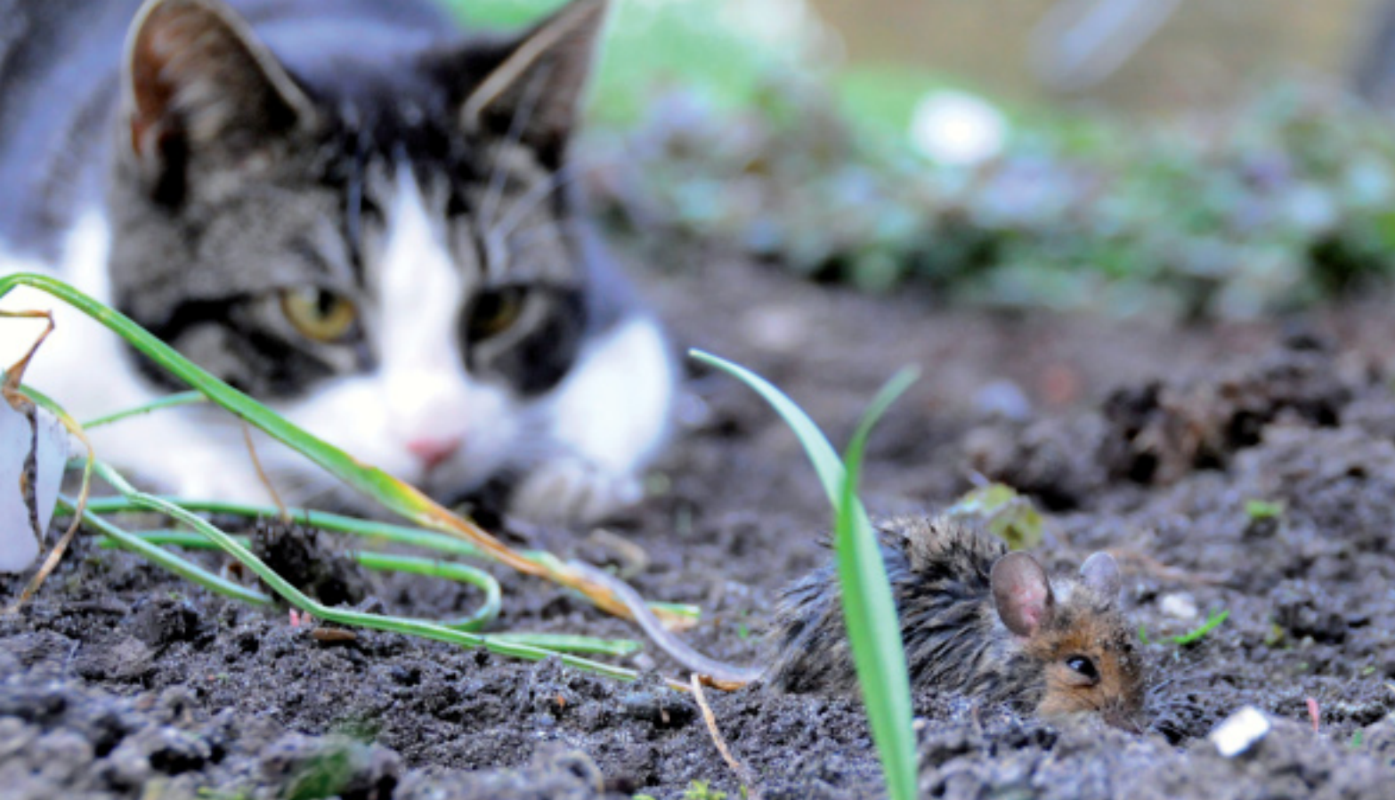
Een van de acties van Zoogdieratlas.nl was de oproep voor foto's van kattenprooien.

De levende digitale atlas van zoogdieren in Nederland