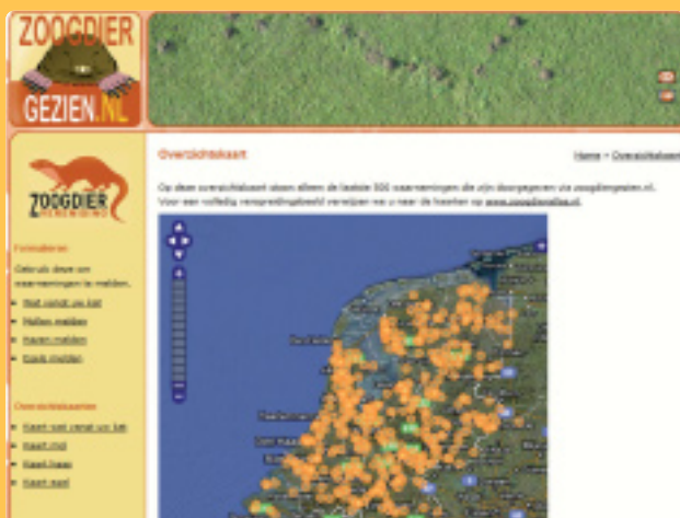
Mollenwaarnemingen kunt u doorgeven via de speciale invoermodule

Mooie voorbeelden zijn de publieksacties 'Molshopen', 'Kattenprooien' (zie kaders), 'Egels' en 'Hazen rond Pasen' die in 2010