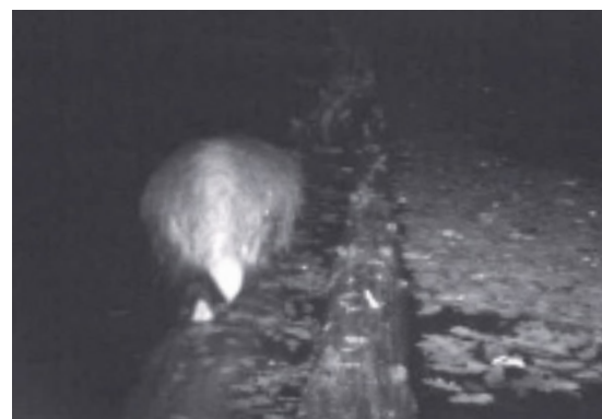
De dikke das loopt voorzichtig over de glibberige boomstam