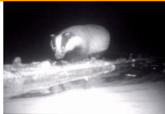
De dunne das op de drijvende stammen