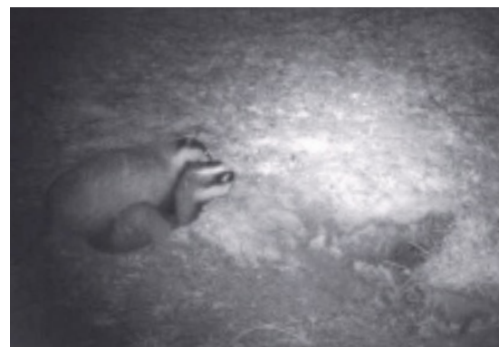
De dassen paren op de burcht