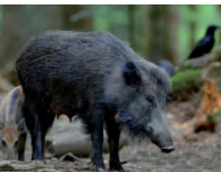
Wild zwijn.

Met een onlangs verschenen rapport van het Europees Milieuagentschap werd het weer eens pijnlijk duidelijk. De landschapsversnippering in Europa neemt nog steeds toe en niet verrassend ligt het epicentrum van die versnippering in de Benelux. De gevolgen zijn bekend: de habitat van zowel dieren als planten verkleint, randeffecten vergroten, populaties geraken geïsoleerd en kunnen nauwelijks of niet meer standhouden.