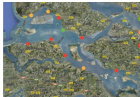
Overzicht van de hotspots rond de Oosterschelde gebaseerd op het onderzoek van Stichting Rugvin.