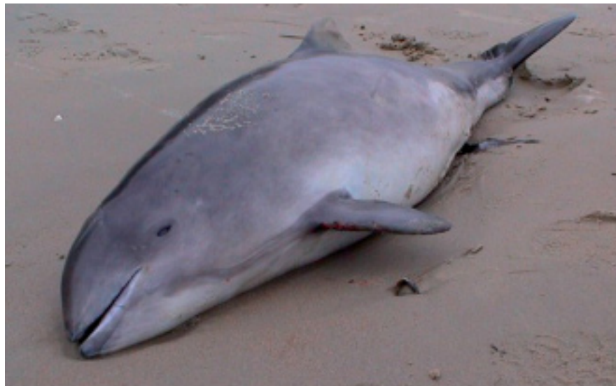
Aangespoelde bruinvis.