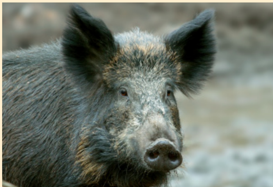
Wild zwijn.

Wilde zwijnen met rossig haar, hebben meer last van oxidatieve stress. Moeilijk woord, maar geen paniek. Het volstaat te