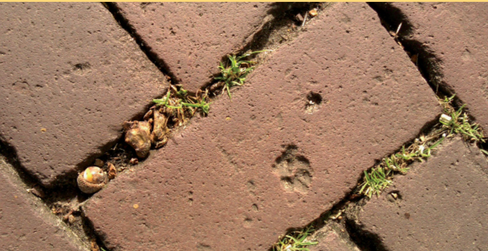
Prent van een kat in een gebakken klinker.