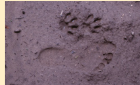
De prent van een pardellynx en die van de fotograaf.