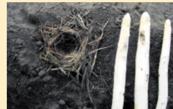
Nest van een (bos)muis, afkomstig uit een aspergebed.