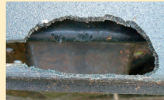
Knagerij van bruine rat aan compostvat.