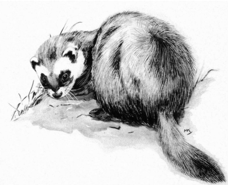
Er zouden 'te veel' Bunzingen zijn. Tekening: Marius Kolvoort.

Als een bepaalde prooidiersoort in aantal achteruitgaat, richten de Bunzingen zich op een meer algemene soort. Juist door die flexibiliteit kan de Bunzing een stabiliserende invloed hebben op ecosystemen (De Bruyn 1980).