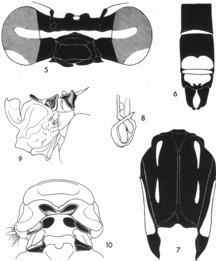
Fig. 5-10. Chlorocnemis interrupta sp. n., ♂ et ♀: (5) tête du mâle de face; — (6) extrémité abdominale du mâle; — (7) synthorax du mâle; — (8) prophallus, profil gauche; — (9-10) prothorax de la femelle, de profil (9) et de dessus (10).

Tête noire, barrée transversalement d'une bande continue bleu-turquoise, se prolongeant sur chaque oeil chez les individus vivants (Fig. 5); cette bande sépare