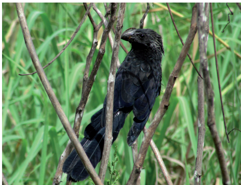
De Kleine Ani of Kawfutuboi is vaak in buurt van koeien te vinden.