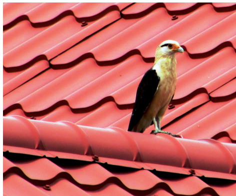
Geelkopcaracara op het dak van een huis in aanbouw aan de Gummels.

borstje of Zwartkopsoldatenspreeuw Sturnella militaris . Het mannetje heeft een opvallende, rode borst, het vrouwtje is bruin. Ze maken hun nest, zoals bij ons de Veldleeuwerik, op de grond tussen hoge grassen. Speurend naar insecten vanaf één tot twee meter hoge uitkijkpunt wisselen ze een kort 'tjiep tjiep' af met een langgerekt 'tsjiiiii'. Ook lopen achter het prikkeldraad, in de paardesporren regelmatig Glanskoevogels Molothrus bonariensis , de mannetjes zijn zwart met een blauwpaarse glans en de vrouwtjes grijsbruin. Het zijn broedparasieten, die bij voorkeur het nest van de Huiswinterkoning Troglodytes aedon uitkiezen om er één ei in te leggen, de rest van het legsel gaat dan verloren. Ook huist daar de Witkopwateriran Arundinicola leucocephala , die in Suriname Soeur of Dominee wordt genoemd. Het is één van de