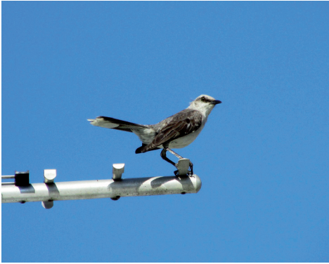
De Tropische Spotlijsters kiezen in Oxygen Resort vaak een antenne als uitkijkpost.

bessen, die ze op een stoep stukslaan om het vruchtvlees te eten, de harde nootvrucht laten ze liggen. Ze bouwen een open nest, vergelijkbaar met dat van een Gaai, van takjes, met een nestkom van dunne plantewortels en dode grasstengels. De eieren zijn groen met roodbruine stippen en vlekjes, vergelijkbaar met die van onze Grote Lijster.