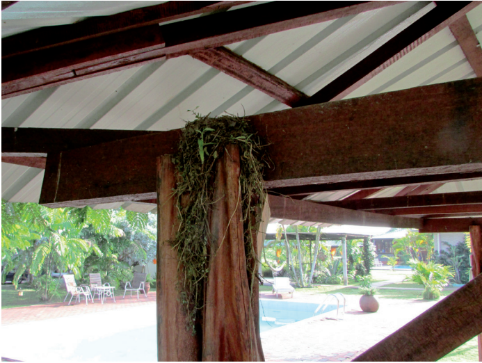
Nest van een Vaalborstlijster in een prieel op het complex.

de vroege ochtend tot de late avond hoor je zijn roep: 'grietjebieeee'! Het is een forse, brutale vogel, die in elke straat kan worden gehoord en gezien. Hij heeft de grootte van een Spreeuw, een gele buik, een witte keel en veel bruin aan de bovenzijde. Om zijn kop loopt een witte band, die begint bij zijn stevige snavel. Op telefoondraden en daken zie je hem midden in de hitte van de dag zich druk maken en aldoor zijn naam roepen. Hij maakt in struiken, maar ook tegen huizen, een bolvormig, slordig nest van dode grassen met aan de voorzijde een invliegopening. Zijn eieren zijn witroze met op het stompe eind donkerbruine stippen, vergelijkbaar met die van onze Zanglijster, waarvan de eieren evenwel hemelsblauw zijn. Hij verdedigt zijn