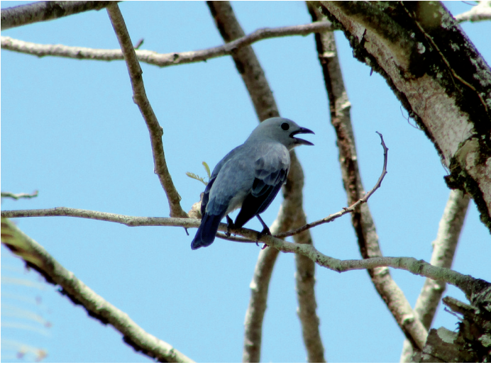
Een Blauwtje zit even uit te puffen in de hitte.