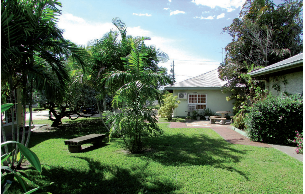
Het uitzicht vanaf onze veranda op het resort.