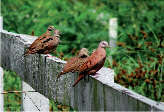
Steenduijjes broeden ook op Oxygen Resort.