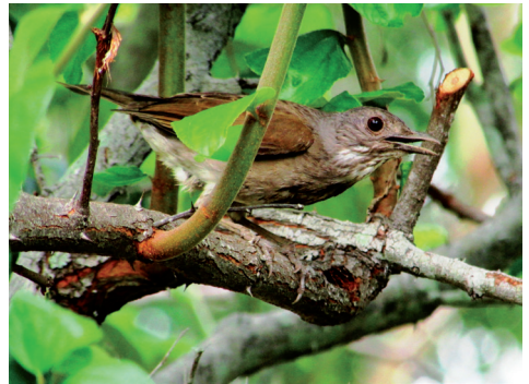
Vaalborstlijster in de omgeving van het nest.

De Grote Kiskadie Pitangus sulphuratus , bekend als 'Grietjebie', is verreweg de meest voorkomende vogel van Paramaribo. Van