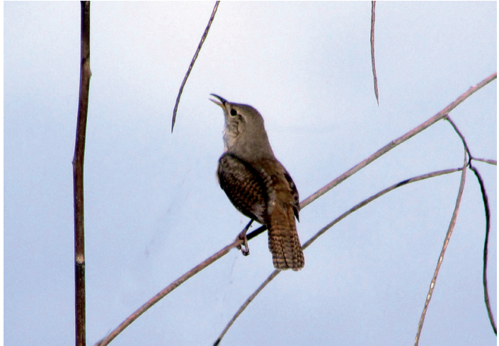
Een Godsvogeltje dat dagelijks het hoogste lied zingt.