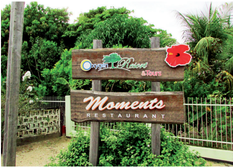
De ingang van Oxygen Resort en een overzichtopname van het complex.

In december 2012 was ik in de gelegenheid vogels te observeren op 'Oxygen Resort', een kleinschalig vakantiecomplex aan de Gummelsweg (Kwatta) in Paramaribo. In dit artikel wordt een indruk gegeven van de daar door mij aangetroffen en gefotografeerde vogelsoorten. Groen lustoord