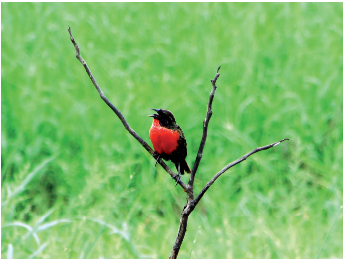
De Soldatenspreew is een opvallende gast in het weiland in de omgeving.

Behalve de vaste bewoners zijn er een aantal algemeen voorkomende passanten en soorten die zich ophouden in de directe omgeving. Wat betreft de passanten kunnen worden genoemd: de Grijsborstpurperzwaluw Progne chalybea , die vooral na een regenbui over het resort komt scheren, de Mangrove-reiger Butorides striata , in Suriname Tjontjon genaamd. Het is een kleine reiger (hij lijkt meer op een Kwak) met een stevige snavel en bruine veren op zijn keel en borst. Ik zag hem enige malen over de zuidelijke goot vliegen. Ten slotte, niet te missen, de Oranjevleugelamazone Amazona amazonica , de meest voorkomende