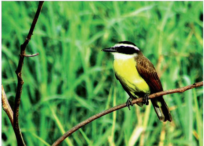
De Grote Kiskadie staat in Suriname bekend als de Grietjebie.

De sloten, aan weerszijden van het resort, liggen vol met afgevallen takken en kokosbladeren. Hier zijn dagelijks een tweetal soorten