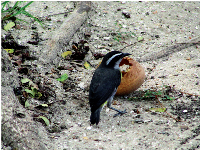
Een Suikerdiefje doet zich tegoed aan een zoete Sapotillevrucht.

meest voorkomende van de zeventig à tachtig Surinaamse tiranvogels.