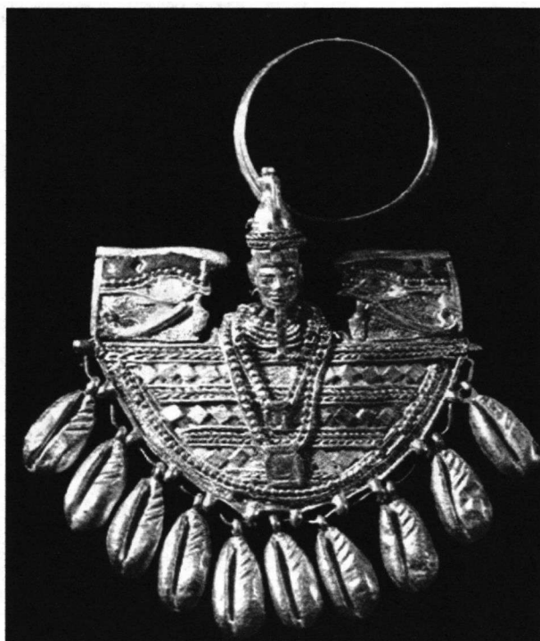
Fig. 9 Schildring, 3,7 x 3,7 cm, goud en glaspasta; Meroë, pyramide van Amanishakheto, laatste kwart 1ste eeuw v.Chr. München, Staatliche Sammlung Ägyptischer Kunst..