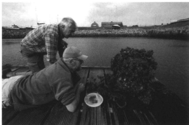
Onderzoek naar de begroeiing op een ponton in de haven van Wemeldinge.

Elke maand houden we ook een excursie (doorgaans op zaterdag). We gaan zeer regelmatig naar de Oosterschelde vanwege zijn grote rijkdom. Daar gaan we bij laag water onderaan de dijken stenen keren en houden we van bepaalde stekken een inventarisatielijst bij. Uiteraard staat ook het strand, van IJmuiden tot de Kaloot, op het programma. Zo nu en dan gooien we daar ook een kornet het water in om garnalen, platvisjes en ander spul boven water te halen. De afgelopen jaren hebben we ten slotte een paar keer een snorkelexcursie