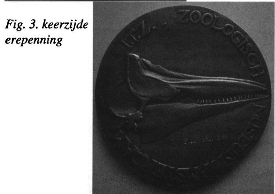
Fig. 3. keerzijde erepenning