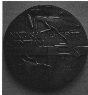
Fig. 2. voorzijde erepenning

Na afloop vond er een receptie plaats in de grote tentoonstellingszaal van het museum.