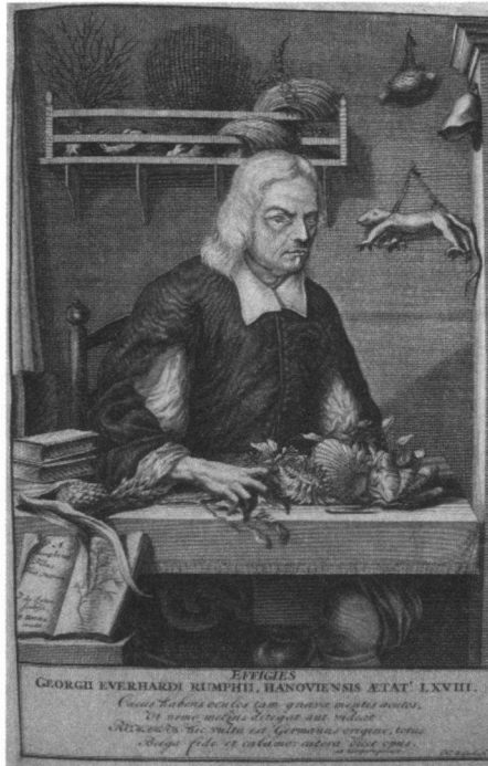
Rumphius, zoals hij in 'D'Amboinsche Rariteitkamer' staat geportretteerd.

Sinds eind juni 2006 heeft Miramar zeemuseum in Vledder een prachtige tentoonstelling over 'De Blinde Ziener van Ambon'. Onder de titel 'Rumphius' Rariteiten' worden enkele fragmenten uit het werk van deze beroemde 17e eeuwse natuurvorser getoond met daarbij de 'hedendaagse versies' van de rariteiten voor zover die nog traceerbaar waren. Het materiaal is uitsluitend geselecteerd uit de studies die Rumphius maakte over zeedieren zoals kreeften, krabben, zeesterren en zee-egels, slakken en andere weekdieren. Op prachtig ingekleurde platen zijn de dieren uit die tijd te bewonderen. Daarbij worden vele wetenswaardigheden en een korte film over Rumphius getoond. De tentoonstelling duurt tot september 2007. Voor de platen heeft een 'nieuwe ontdekking' van een gedeeltelijk ingekleurde versie van de Rariteitkamer model gestaan.