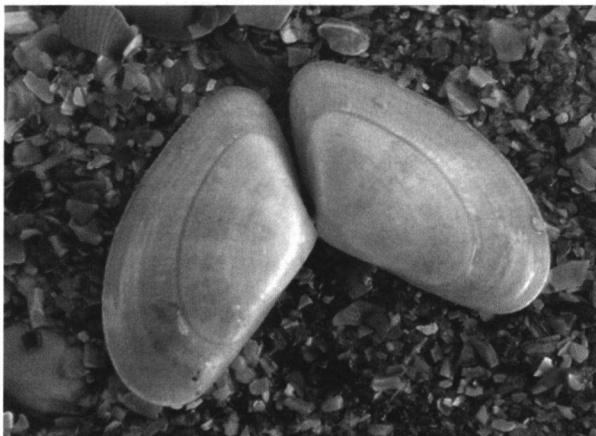
Doublet van het zaagje, Donax vittatus .

Heel leuk is het volgen van invasies. Het Zaagje ( Donax vittatus ) was jaren afwezig voor de kust bij Katwijk en in 2006 waren er ineens zeer grote aantallen levende exemplaren aangespoeld.