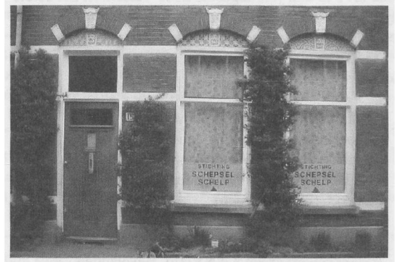
FIGUUR 2. MUSEUM SCHEPSEL SCHELP KIEVIETDWARSTRAAT 15 UTRECHT

het Bekken van Parijs. Het museum is gevestigd op drie verdiepingen van het perceel Kievitdwarstraat 15 te Utrecht, maar je moet bellen op nummer 17. Geestdriftige mensen zijn altijd zeer welkom.