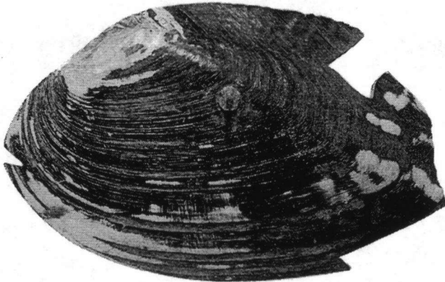
Bijzondere zoetwatermossel (spec.) uit de grachtvulling van de Nieuwehaven te Gouda. Boven: binnensijde, onder buitensijde.