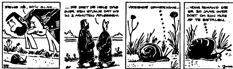
Uit: Leeuwarder Courant, 30 augustus 1997. (Ingest. door H.H. Dijkstra)