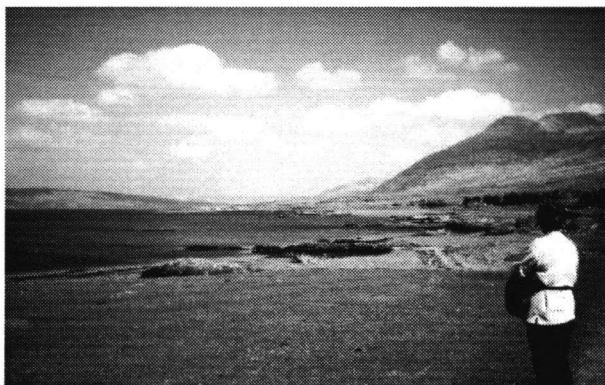
Zicht op Loch na Keal, een vindplaats van Mimachlamys varia nivea .

Mossels, Pelikaansvoeten, Paardenmossels en ook erg veel exemplaren van Mimachlamys varia nivea . Een grondige inspectie van mosseltonnen leverde doubletten en losse kleppen van Aequipecten opercularis op. De volgende zoekplaats was Loch na Keal en daar lagen ze dan: vele doubletten en als resultaat van snorkelbezigheden ook diverse levende exemplaren van Mimachlamys varia nivea . Het spreekt vanzelf dat we vele uren zijn gebleven. Niet alleen zoeken, fotograferen en indrukken van het omringende landschap vastleggen, maar ook luisteren naar de muzikale begeleiding door Anneke terwijl ondertussen Gerrit bezig is met het schoonmaken van zijn vondsten. Als laatste excursiepunt gingen we door naar Tobermory om daar de nacht door te brengen.