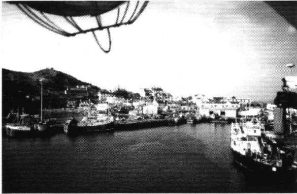
De haven van Mallaig.

Fuikhoorns, Ensis siliqua ), Portgordon ( Patella , Alikruik, Purperslakken), Buckie (Noordhoorns, Slanke noordhoorns, Astarte montagui , Dentalium (ook levende exemplaren)), Portknocky, Portsoy, Banff, Fraserburgh ( Turritella communis ) en Peterhead (grijze zeehonden) vormen nu voor ons bekende klanken. Aberdeen werd het eindpunt van deze excursiedag.