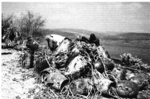
Een grondige inspectie van de mosseltonnen op het eiland Mull.

We verlaten nu Oban en gaan naar Mull (daar ligt mooi spul), maar eerst toch maar naar de haven om schepen te inspecteren. Dit leverde soorten op zoals Nuculana minuta , Astarte sulcata , Musculus subpictus , Arctica islandica , Trivia , Pelikaansvoet, Timoclea ovata , Turritella communis en Dosinia exoleta . Op Mull werd het strand bij Craignure bezocht. Hier lagen veel