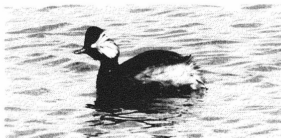
Geoorde fuut

Bij het haventje van de Brouwersdam begon onze volgende speurtocht. Een mannetje ijseend zwom vlak langs de kant en een zeekoet stond heerlijk te zonnen op de basaltblokken.