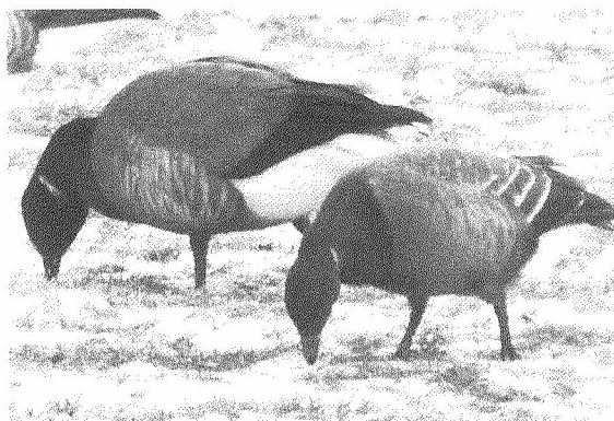
Rotganzen in de sneeuw.