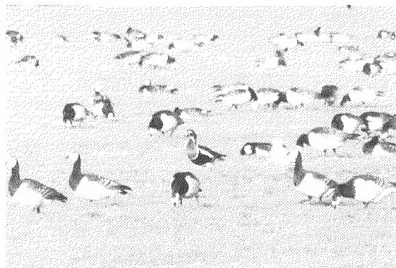
Een roodhalsgans tussen brandganzen

Verheugd waren we toen we zagen dat Nico gelijk had. Dat gunden we hem natuurlijk sowieso. Voor ons belangrijker, de kleine rietganzen zaten in hun weiland. Niet 10, niet 50, ruim 200; grijsblauwe rug en ja hoor roze poten, onmiskenbaar kleine rietganzen. We maakten ons klein tussen de auto's, uit de wind, zodat we toch de rietganzen met de telescopen konden bestuderen. Het zal zeker een jaar duren voordat ze weer in Nederland zijn.