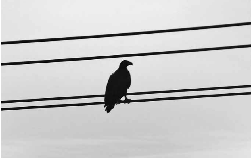
Zearend op kabel van hoogspanningsmast, Hellegatsplaten, najaar 2014. White-tailed Eagle near Hellegatsplaten, autumn 2014.

terugkeer in Groot-Brittannië waar, na een jarenlange door de Royal Air Force verzorgde luchtbrug van zeearendpullen vanuit Noorwegen, de soort zich hervestigde, volgde er in Nederland een pleidooi een herintroductieprogramma op te zetten. Voor en tegenstanders van die optie gingen in discussie. In 1996 kwam de vergunning af, die echter onbenut een lade inging. Tien jaar later vloog in Nederland de eerste jonge Zearend uit. Zonder kunstgrepen. Applaus.