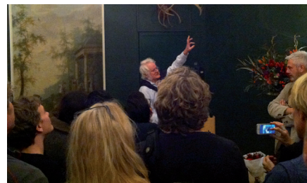
▲ Redmond O'Hanlon opende de tentoonstelling 'Endangered'.