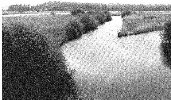
Uitzicht vanaf de vogelkijkhut Diependal

Van de voormalige aardappelfabriek is nu nog een lange onderaardse gang over. Wanneer je erdoor loopt kom je aan het eind in een mooie grote vogelkijkhut. De voormalige vloeivelden waar je dan op uitkijkt zijn nu een waar vogelparadijs. Ondanks het grijze en natte weer ontdekten we roodhalsfuut, grote zilverreiger, bruine kiekendief en vloog er een lepelaar langs.