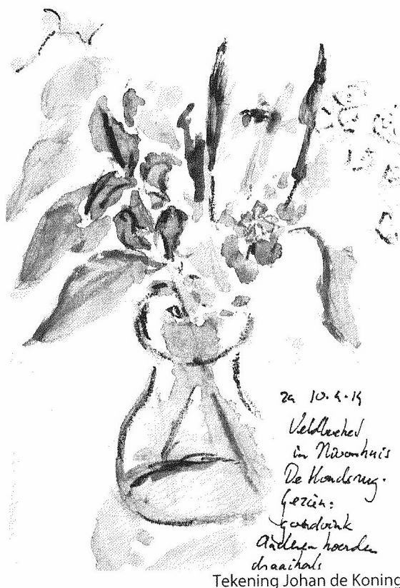
Tekening Johan de Koning